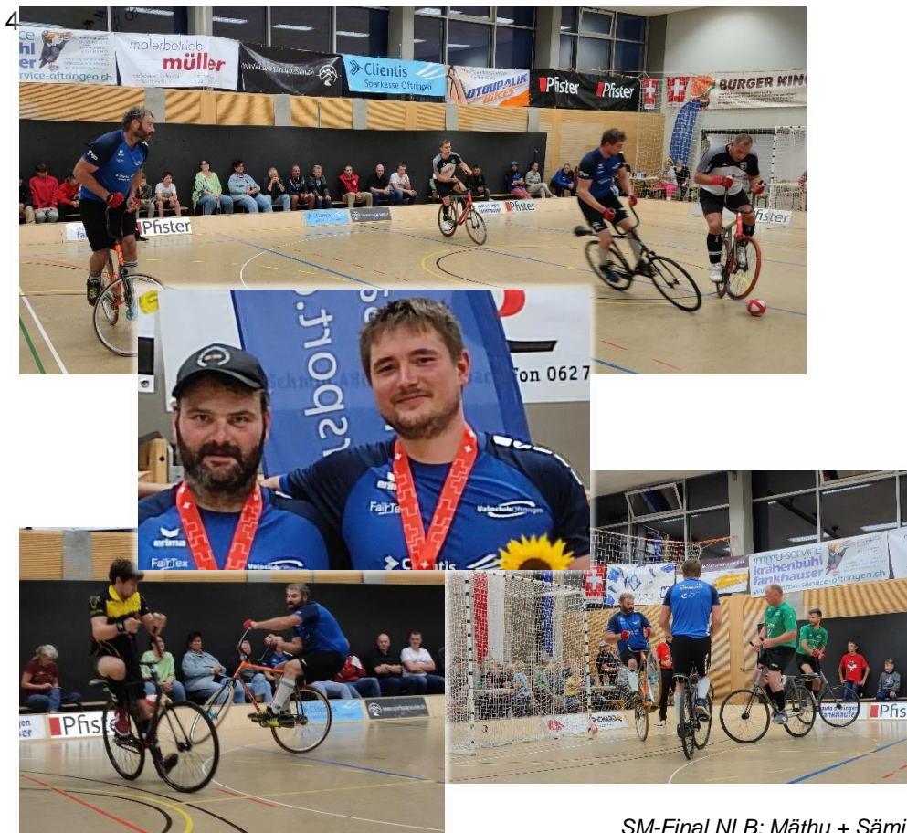
SM-Final NLB: Mäthu + Sämi